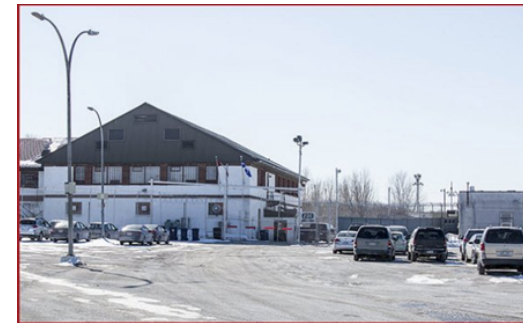
(Centre de surveillance de l'immigration à Laval, au nord de Montréal. Source de l'article : courrierlaval.com )

Le jeune homme a été contraint de fuir le continent africain parce qu'il y avait menace pour sa vie dans son pays d'origine. À son arrivée ici, il a tardé avant de demander l'asile. « Je ne savais pas comment on faisait, je n'ai pas dit les bons mots-clés... J'aurais dû le demander plus rapidement. »